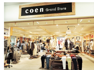
(グランドストアららぽーと立川立飛店 2015年12月オープン)