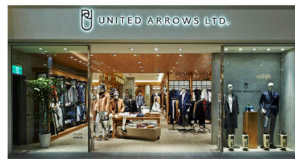
(UA LTD. OUTLET(三井アウトレットパーク台湾林口) 2016年1月オープン)