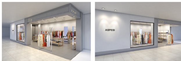
(アスベジ 名古屋店(CG) 2016年3月オープン)